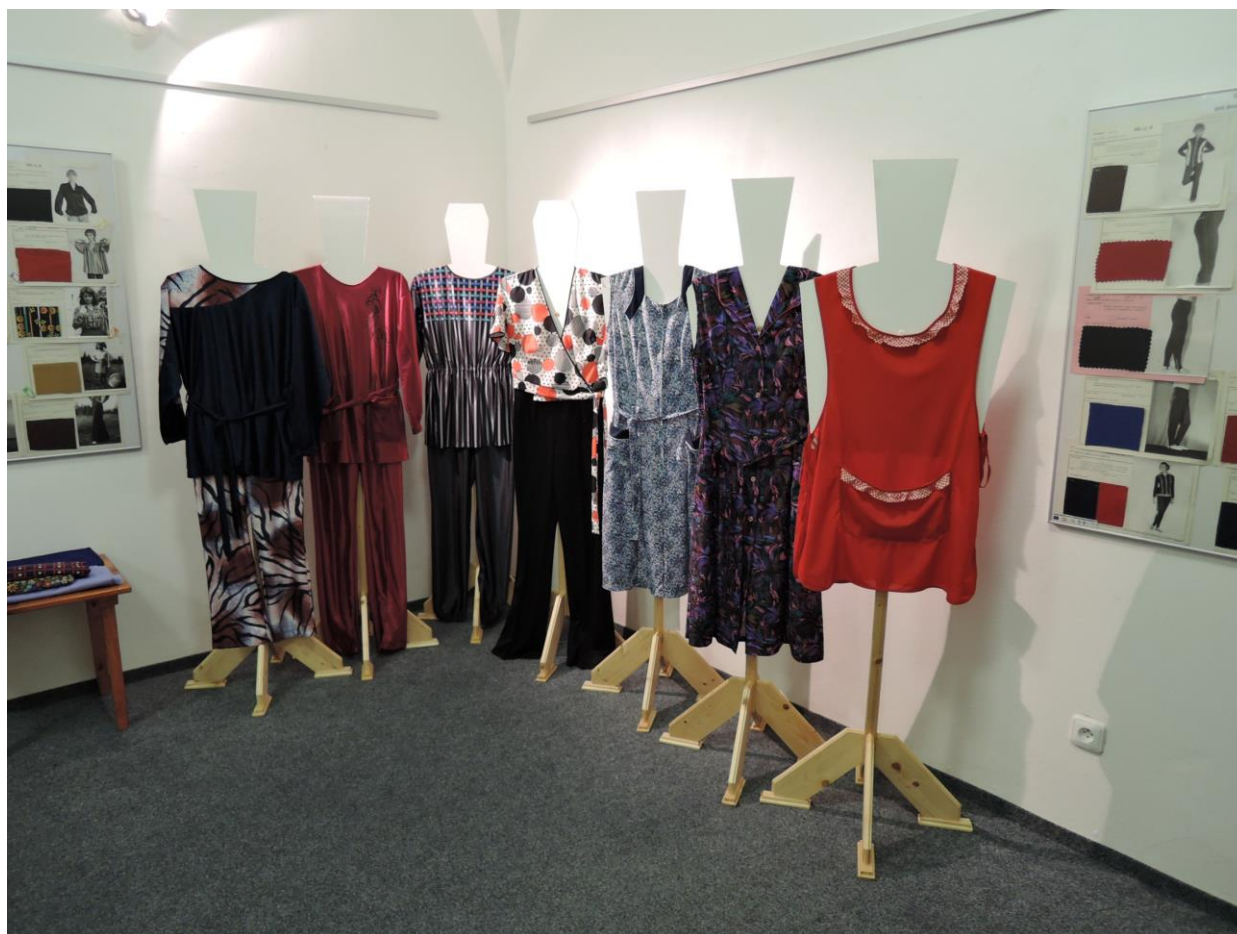
Ašská totalitní móda – dámské domácí komplety a zástěry