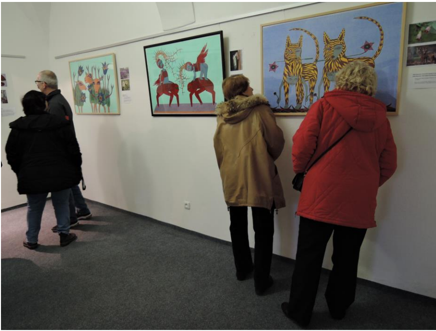
Výstava obrazů Kateřiny Piňosové – Les ve mně